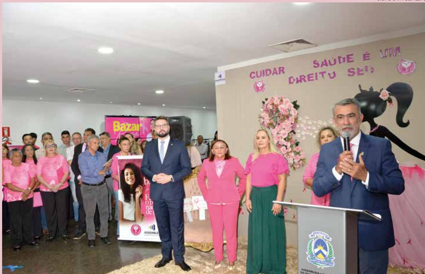
Todos os anos a Aleto mobiliza servidores e comunidade na campanha “Outubro Rosa”

da Monteiro (UB), permite que todas as trabalhadoras do Estado tenham o direito a uma folga anual para a realização de exames preventivos contra o câncer de mama e colo de útero. Para que a população em geral seja informada sobre esse direito concedido às mulheres a Lei Estadual nº 4.076/2022, torna obrigatória a afixação de placas informativas em estabelecimentos públicos e privados.