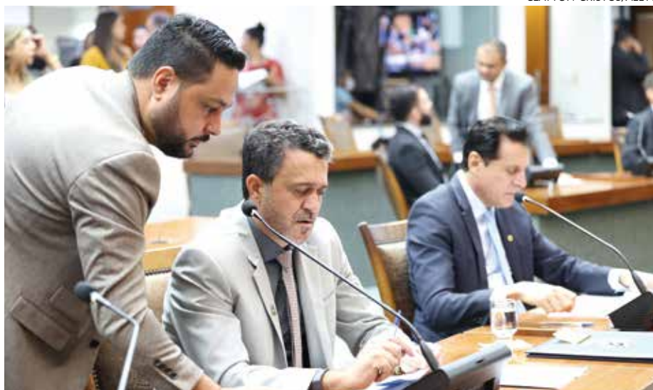
Parlamentares utilizam novos displays gráficos com touch screens

Assim como o Plenário, a Sala das Comissões (Plenarinho) tam-