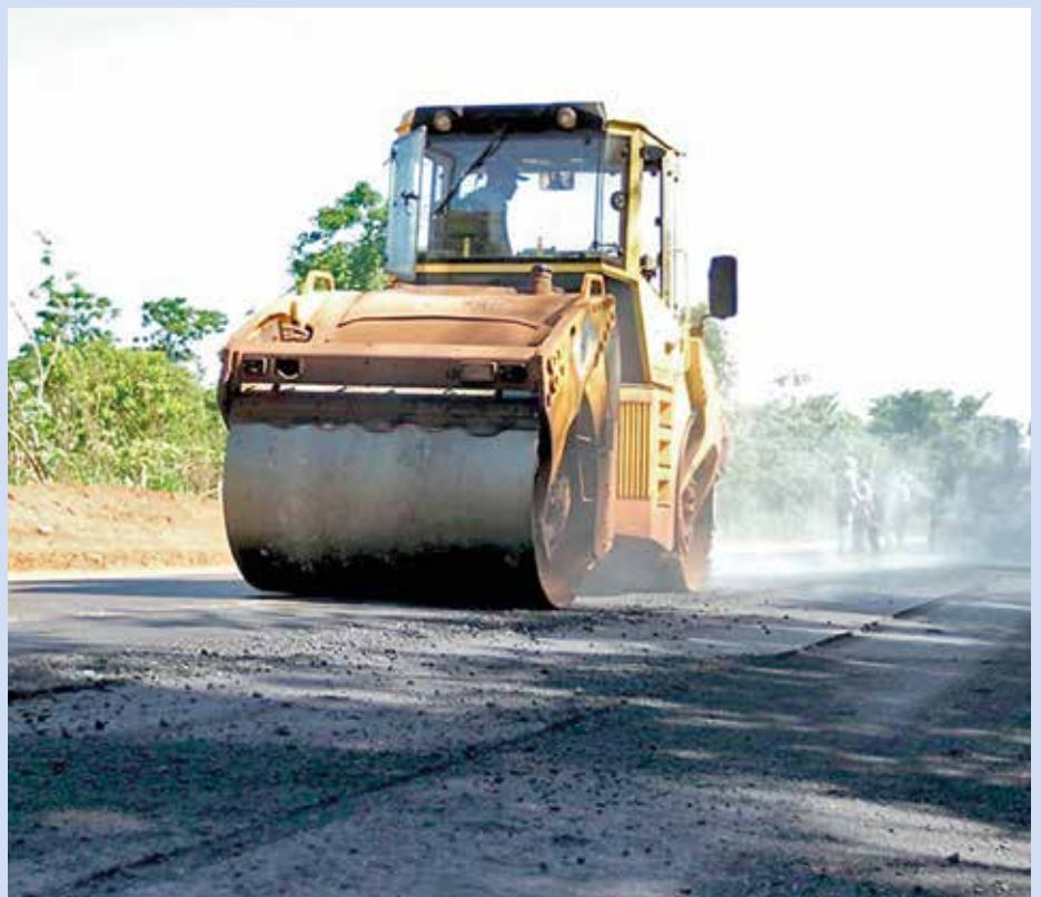
Obras viárias em andamento no Tocantins já restauraram 2.900 km