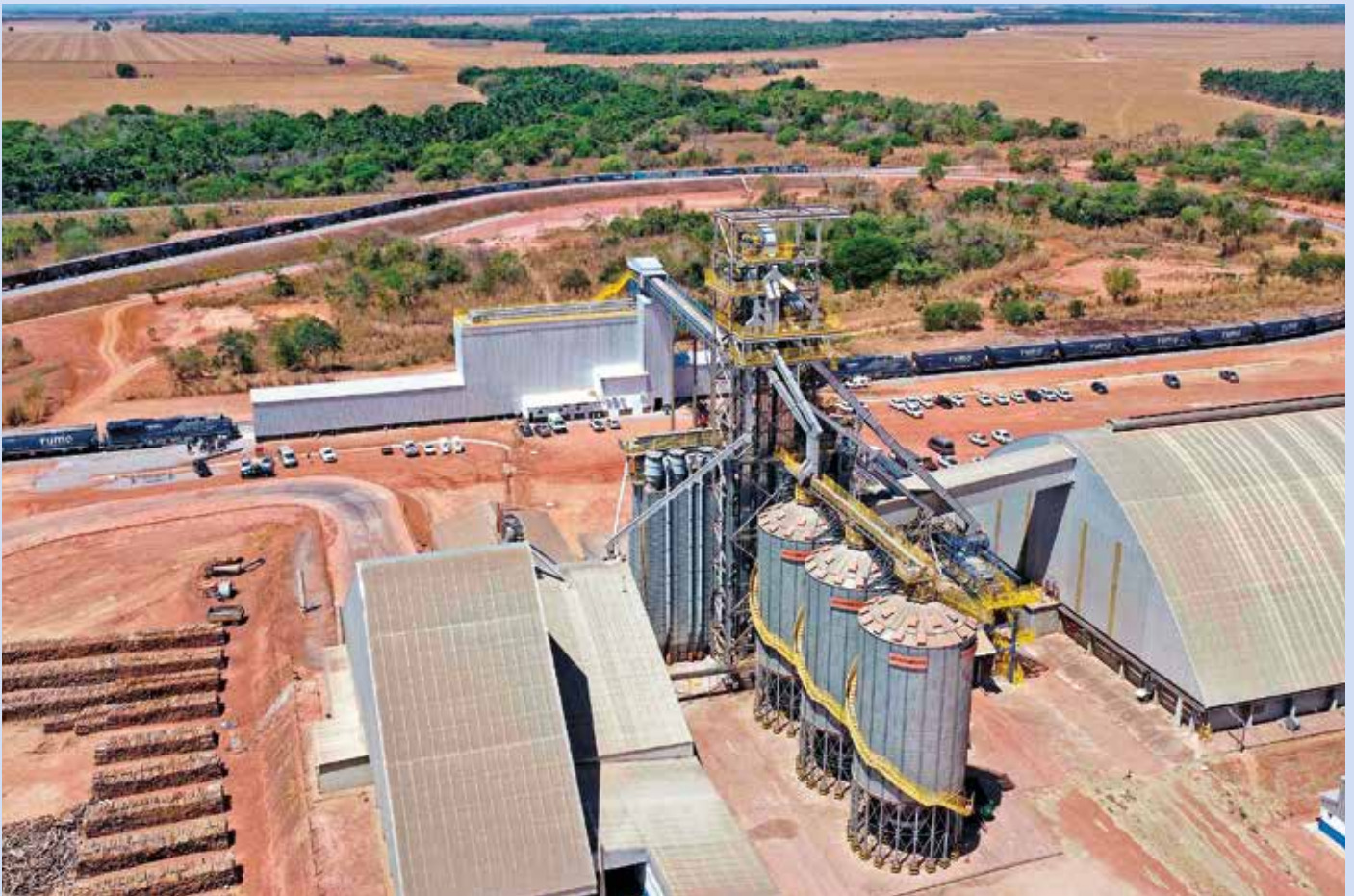
Terminal Rodoferroviário de Alvorada possui pátio multimodal para transbordo de grãos

também alcançou recentemente a melhor avaliação no Índice de Desenvolvimento da Educação Básica (Ideb) da Região Norte do Brasil, reforçando o compromisso do Governo com a eficiência na aplicação dos recursos públicos.