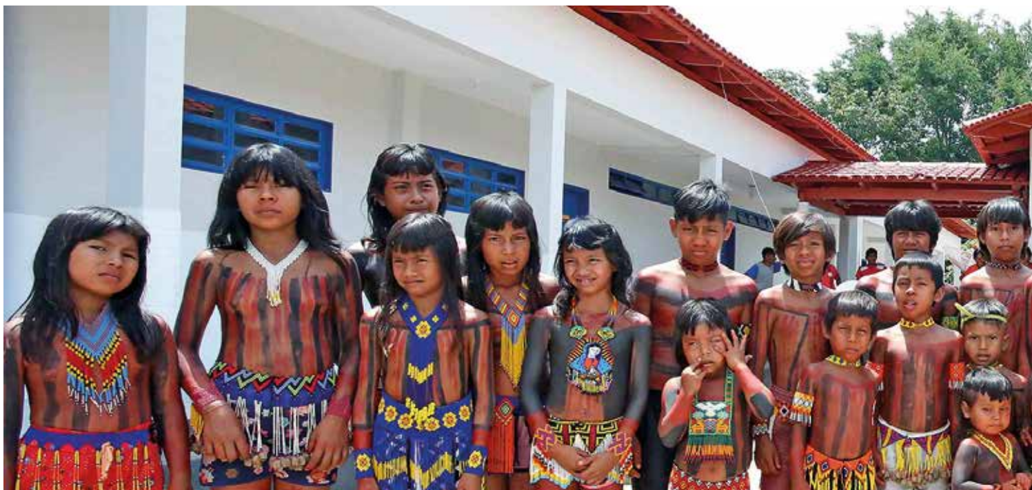
Demandas para melhorar educação indígena foram apresentadas pelas próprias comunidades

Para a Secretaria Estadual de Educação, os parlamentares enviaram dois requerimentos solicitando a reforma e a ampliação da escola da Indígena Waikarnãse, da Reserva Indígena Xerente, em Tocantínia; e da Escola Indígena