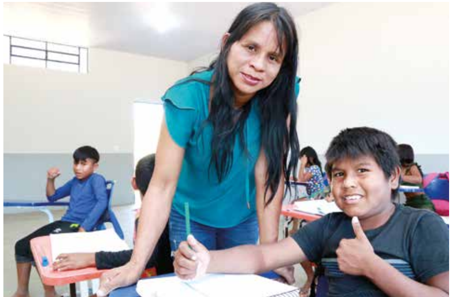
Educação indígena deve incluir saberes e costumes tradicionais

A formação universitária dos povos indígenas também é ponto de atenção dos deputados tocantinenses. Atualmente, o estudante indígena pode acessar os cursos superiores pretendidos por meio das cotas nos processos seletivos. O que não é suficiente, considerando que muitas universidades, principalmente as públicas, não são tão próximas das comunidades indígenas.