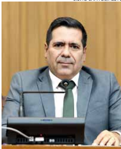
MARCUS MARCELO é deputado estadual pelo PL e presidente da Comissão de Educação, Cultura e Desporto da Aletto.

Já nas sessões no plenário da Aletto, destaco, dentre outras defesas, a solicitação que fiz para viabilizar a instala-