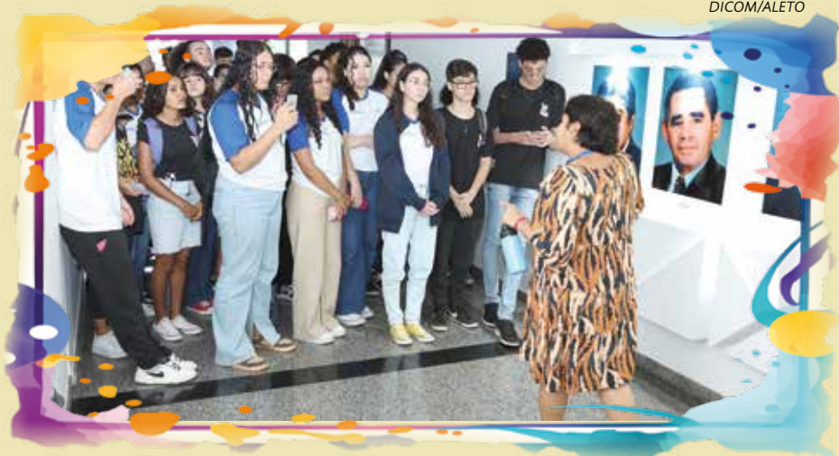
Estudantes conhecem dependências da Aleto durante Visita Guiada