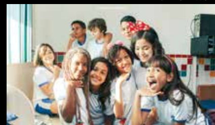
Menina Bonita de França