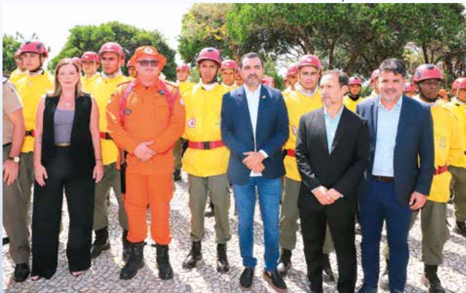
Governador autorizou a contratação de mais 60 brigadistas