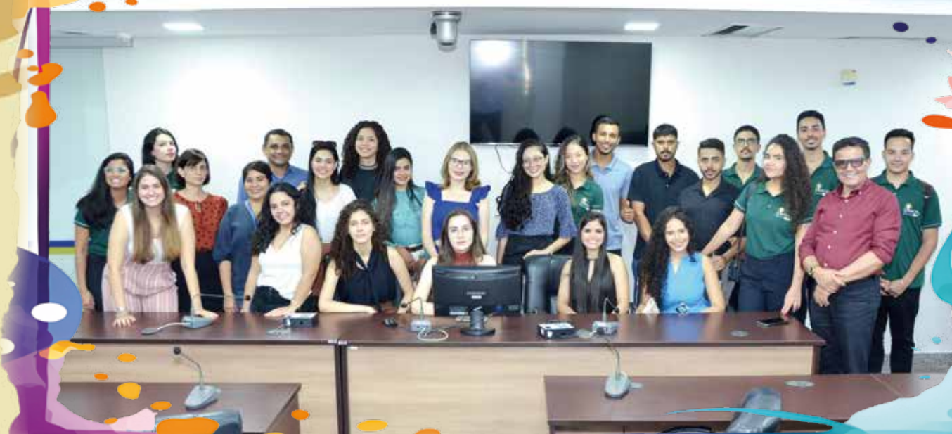
Projeto aproxima estudantes do funcionamento do Poder Legislativo

-relacionam para garantir o pleno exercício democrático.