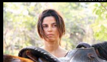
O Barulho da Noite

Seu outro trabalho, o curta "Slate" (2022), dirigido com Alex Slama, também tem circulado em eventos de cinema em Hollywood, Paris, Milão e Lisboa. Em Tokyo, ganhou os prêmios de Melhor Atriz, Melhor Ator e Melhor Direção.