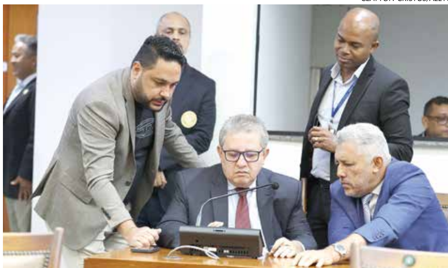
Equipamentos modernizam sistema de votações na Aletto

bém foi contemplada com serviços de atualização do software de operação e gerenciamento do SEV-2000. “Esses e outros equipamentos auxiliam na realização de sessões híbridas, presenciais e remotas”, explica Neris.