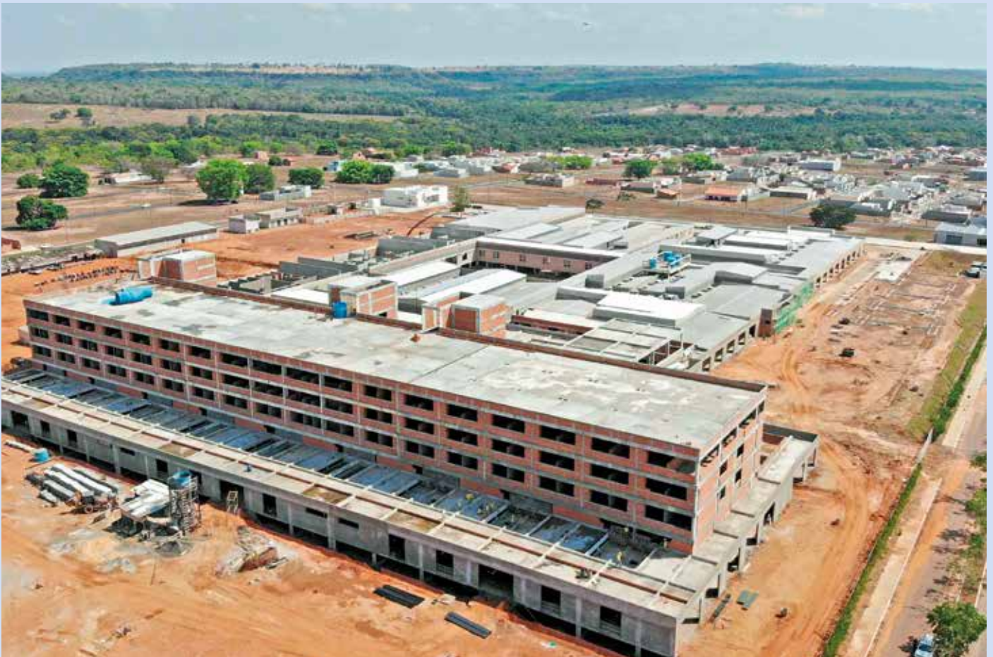
Obras do Hospital Geral de Araguaína estão 70% concluídas

rizando os profissionais que constroem o futuro do nosso Estado”, disse.