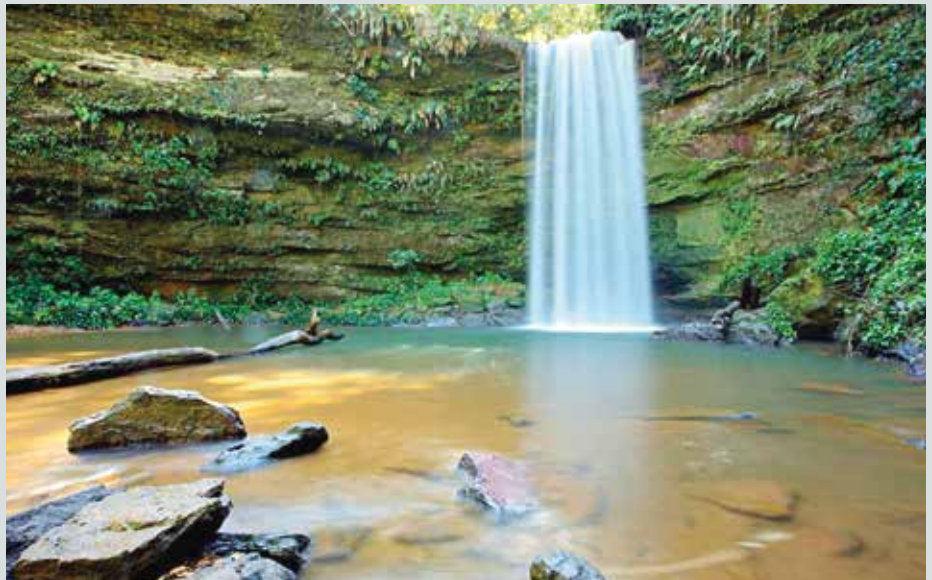
Parque Estadual do Lajeado tem mais de 100 cachoeiras catalogadas

O Sítio Arqueológico Catitu é um outro atrativo imperdível. Localizado no Vão do Canário,