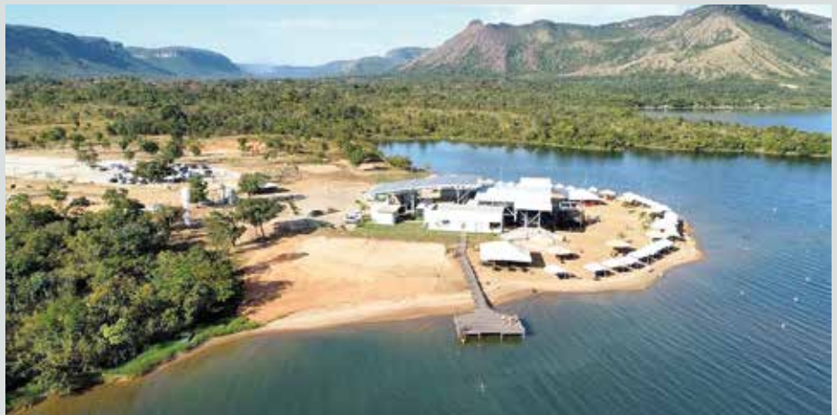
Praia do Segredo tem estrutura preparada para receber os turistas