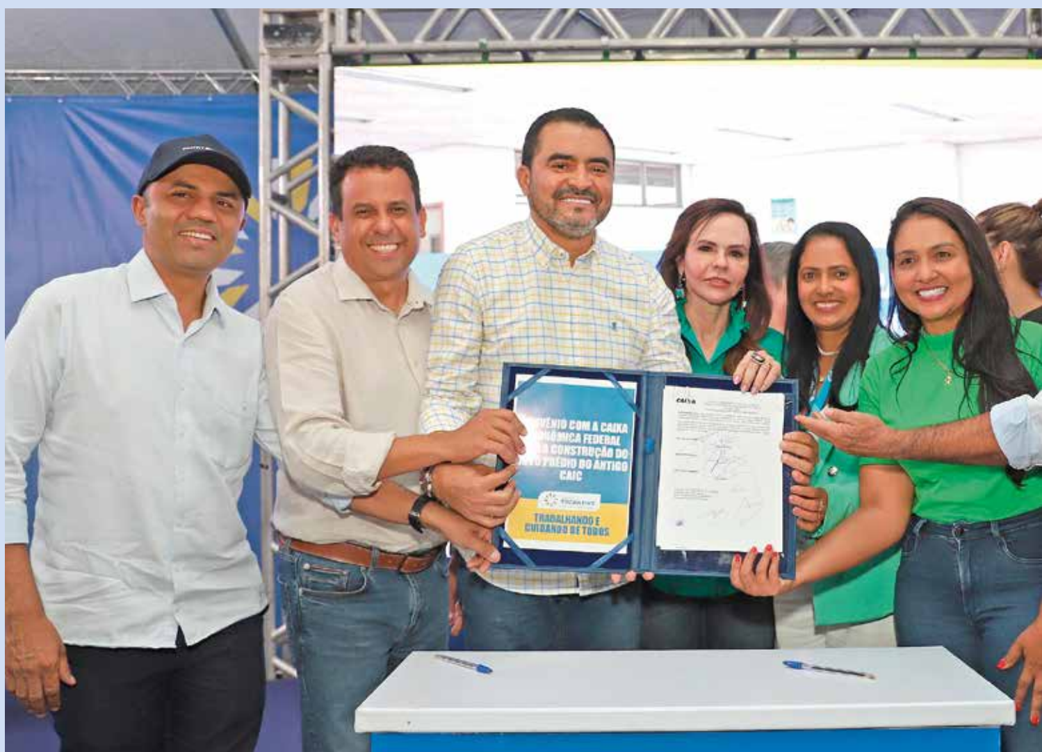
Investimentos na Educação marcam os 36 anos de desenvolvimento do Tocantins

Para os tocantinenses, a data é um símbolo de orgulho e de reno-