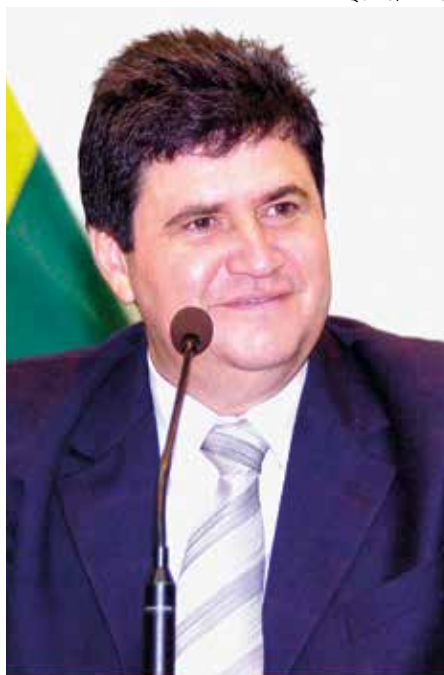
Coimbra presidiu a Aletto em 2009/2010

Ainda na capital federal, foi nomeado, em 2015, secretário nacional de Políticas de Turismo, no governo Dilma Rousseff (PT). Também foi secretário na gestão do ex-prefeito de Palmas, Carlos Amastha, período em que se desincompatibilizou para disputar as eleições em 2018.