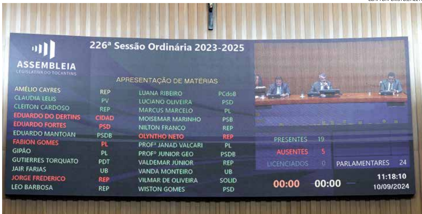
Painel de led full color instalado no Plenário da Aleto